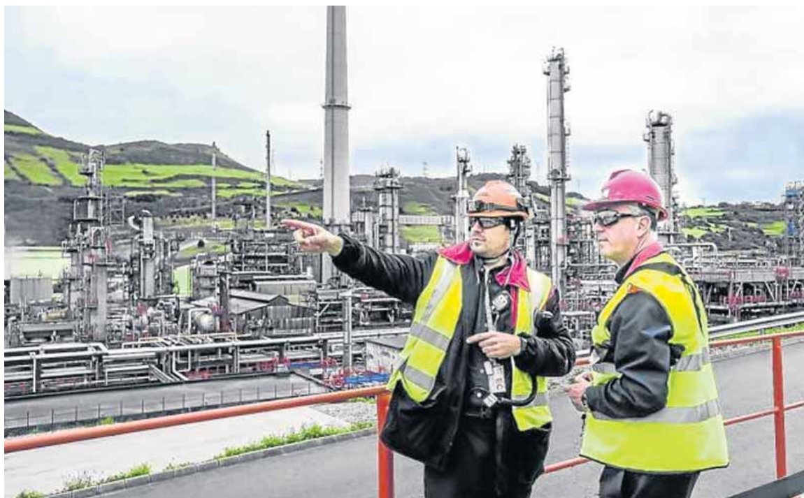
Petronor desarrollará en el Puerto de Bilbao un proyecto de combustibles sintéticos. BORJA AGUDO

Pero, volviendo a la pregunta inicial, las comunidades autónomas han diseñado diferentes hojas de ruta para llegar a la meta. Solo el tiempo demostrará cuáles fueron más acertadas. Unas han decidido tomar la delantera y lanzar ya sus proyectos, con mayor o menor nivel de concreción. En este grupo estarían, entre otras, Galicia, Cantabria y País Vasco. Solo estas tres, a tenor de lo anunciado por sus gobiernos, ya suman 24.173 millones. País Vasco es la más ambiciosa, más de medio centenar de proyectos que supondrían una inversión de casi 12.000 millones; Cantabria enumera 103 proyectos que suman 2.673 millones, y Galicia, 108 proyectos por un importe de 9.500