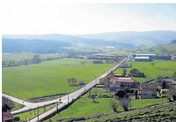
Terreno para el proyecto logístico La Pasiega, Cantabria. EDM